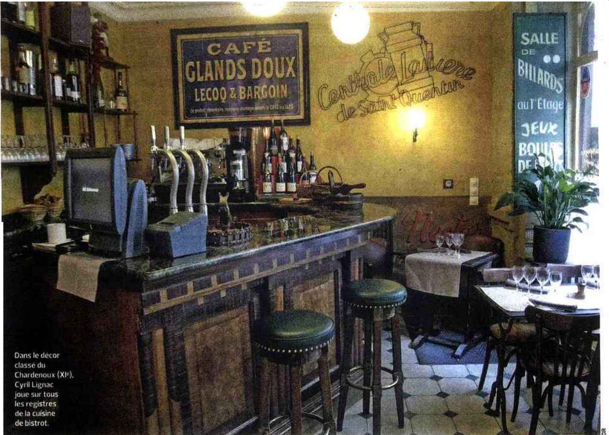
Dans le décor classe du Chardenoux (Xl e ), Cyril Lignac joue sur tous les registres de la cuisine de bistrot.