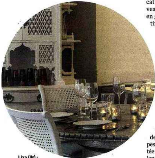
Liza (Ile) : le raffinement d'une table libanaise contemporaine.

Café Moderne, 40, rue Notre-Dame-des-Victoires, Ile. Tél. : 01 53 40 84 10.